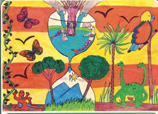
38. Uluslararası Pinar Çocuk Resim Yarışması