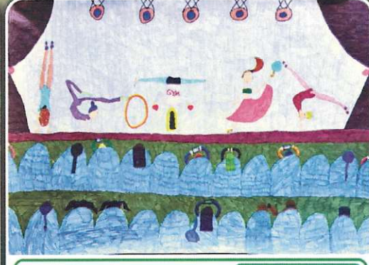
38. Uluslararası Pinar Çocuk Resim Yarışması

Myshzhe SABAĞA - 11 Yaş Wedding Grund Schule ALMANYA