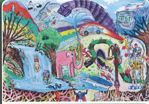
38. Uluslararası Pinar Çocuk Resim Yarışması

Maz BİLGİÇ - 11 Yaş MEB Özel İhtisaplık Sanat Anblyesi Yatenek Turizm İzmir - Ege Bölgesi