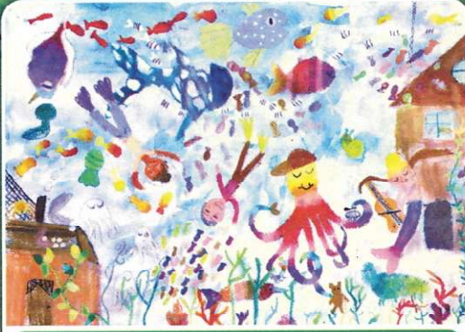
38. Uluslararası Pinar Çocuk Resim Yarışması

Maz BİLGİÇ - 11 Yaş MEB Özel İhtisaplık Sanat Anblyesi Yatenek Turizm İzmir - Ege Bölgesi