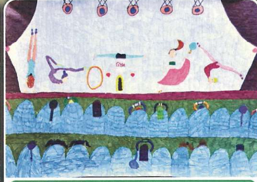
38. Uluslararası Pinar Çocuk Resim Yarışması

Miyuhide SABEVA - 11 Yaş Wedding Grund Schule ALMANYA